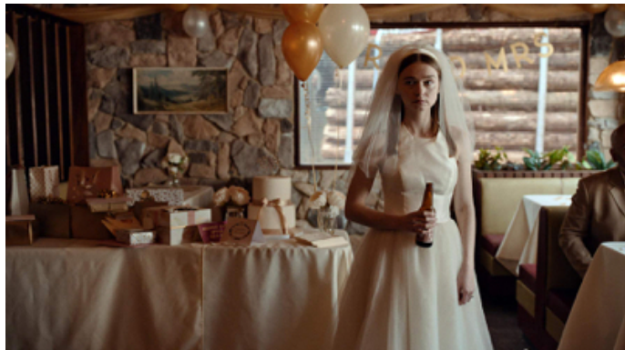
the end of the f***ing world

Nous travaillons sur une esthétique épurée tout en y cherchant son essence dans la théâtralité : l'invention ludique et la fabrication à vue.